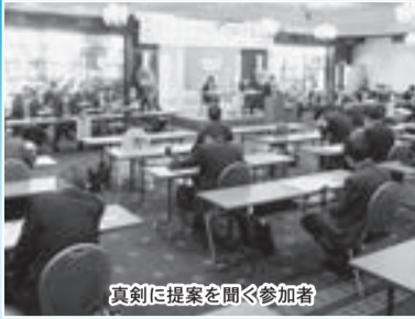
真剣に提案を聞く参加者