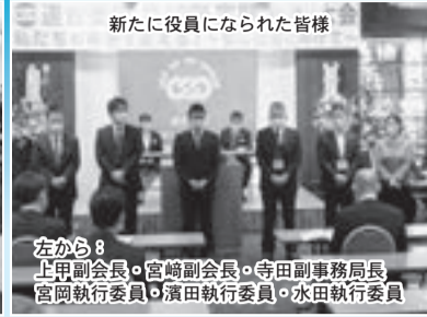
新たに役員になられた皆様