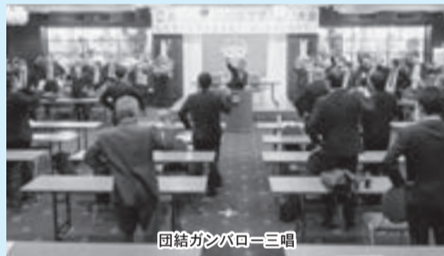
団結ガンバロー三唱