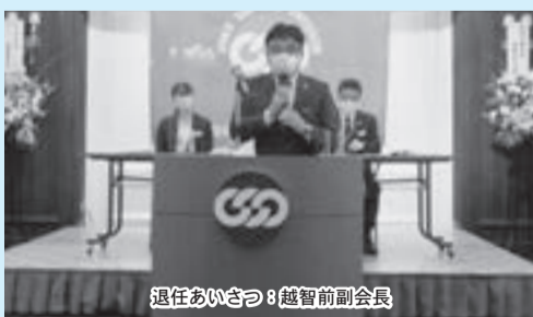
退任あいさつ: 越智前副会長