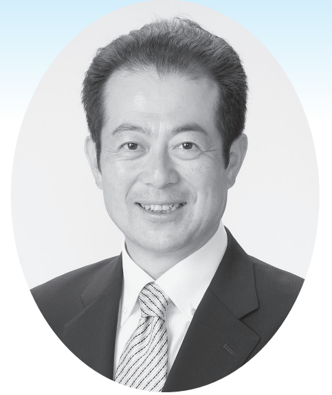
松山市長立候補予定者