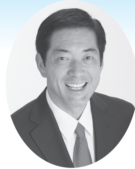
愛媛県知事立候補予定者